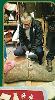
桜の倒木で 作りました

地域の方にご協力いただき、 手作りの椅子を作りました。 1Fロビー等に設置しますので 是非、ご利用ください。